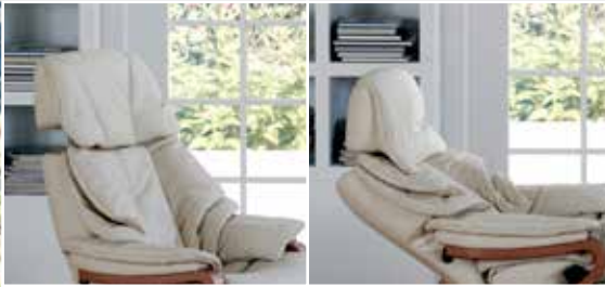
Kopfstütze in der Höhe und im Neigungswinkel verstellbar.